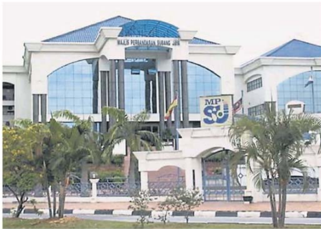
梳邦再也市议会升格在即，但未来不会增加行政开销。

他今早巡视克智华小遮阳棚竣工后时，询及梳邦再也市议会正式获得内閣同意升为市政厅一事时如此回应。