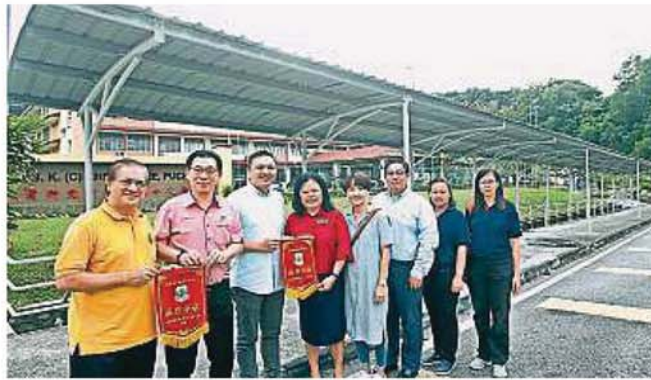
黄思汉（左三）与蒲种竞智华小三机构巡视该校遮雨棚工程。左起为刘有福及叶国荣；右起为陈铃焯、周月春、李伟宏、谢珊珊及陈月年。

（蒲种19日讯）雪州行政议员黄思汉表示，梳邦再也市议会正式获得内阁批准升格为市政厅，一旦宪报工作完成后，梳邦再也市议会即将升格为市政厅。