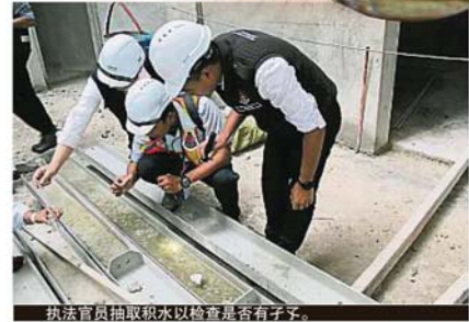
执法官员抽取积水以检查是否有蚊子。