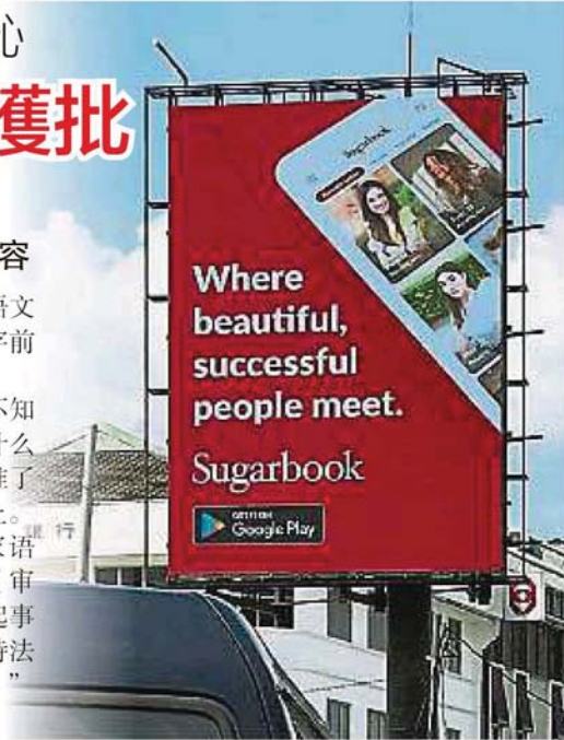
隆市政局已下令管理公司必须撤下Sugarbook的广告。

“根据我们与国家语文出版局的往来,他们(审核)很严格,所以在这起事件发生了什么事?我支持法米对此采取调查的呼吁。”