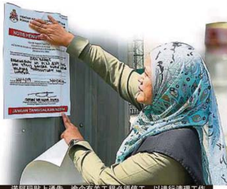
诺阿玛贴上通告,谕令有关工程必须停工,以进行清理工作。