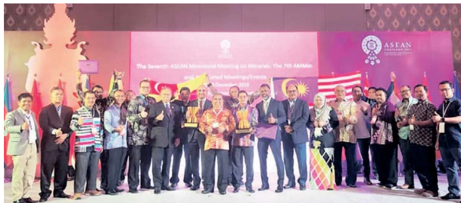
Sebahagian pemenang bergambar kenangan ketika 2nd AMA di Bangkok, Thailand pada minggu lalu.

KSSB telah beroperasi sejak 2008 dan dipertanggungjawabkan dalam menguruskan pengekstrakan, pengeluaran dan pengedaran jualan pasir, bahan batuan dan sumber mineral dengan berobjektif mempromosikan operasi perlombongan pasir yang mampan di Selangor, negeri