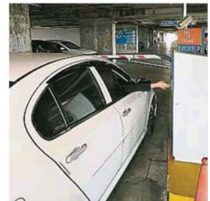
车主在底层索取停车票后，驾驶至第7层楼再把票根塞入取票机，随即取回弹出的票根即可进入停车转乘停车场。