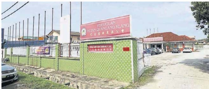
陷的風險。 白蟻侵蝕、屋頂漏水等，隨時會有塌 舊會所已經逾半世紀歷史，殘舊、