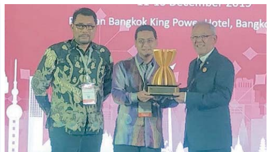
KSSB meraih tempat pertama bagi anugerah kategori Amalan Terbaik Dalam Pembangunan Mineral yang Mampan di 2nd ASEAN Mineral Awards (AMA) di Bangkok, Thailand.

pengeluar produk pasir dan bahan batuan yang terbesar di Malaysia.