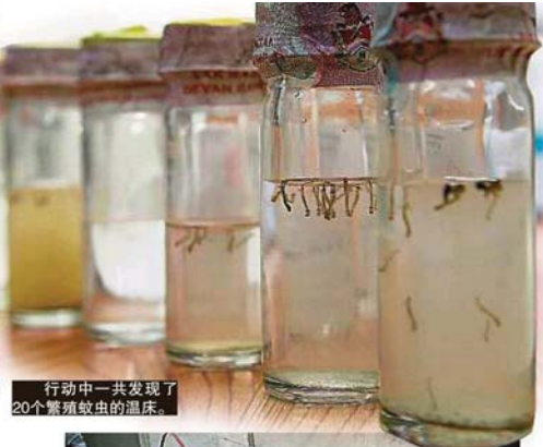
行动中一共发现了20个繁殖蚊虫的温床。