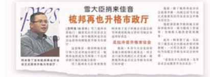
雷大臣宣布梳邦再也市议会获准升格为市政厅。

他也强调，州政府允许地方政府升格时，也制定条件须遵守，即升格后不可增加人手及开销；所以除了从县议员升为市议员的津贴从 2000 增至 2500 令外，其余皆没有改变。