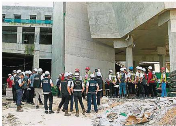
市政局及卫生局出动多名官员参与行动,检查工地是否成为繁殖蚊子的温床。