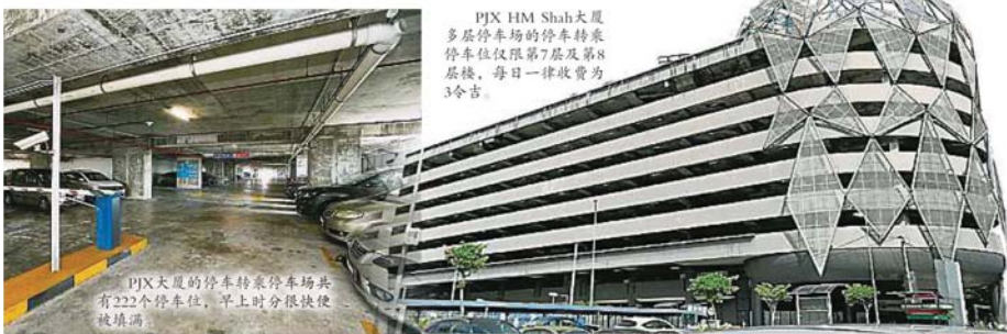
PJX HM Shah大厦 多层停车场的停车转乘 停车位仅限第7层及第8 层楼，每日一律收费为 3令吉。

Provided for client's internal research purposes only. May not be further copied, distributed, sold or published in any form without the prior consent of the copyright owner.