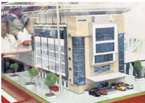
■新會所一共有5層樓高，不過第1層和第5層的樓面比較高，因此從外觀看來有7層樓高。

“我們於1月1日的動土禮當天，凡是認捐10萬令吉便可列為動土嘉賓，參與拿鋤頭土儀式，我們希望當天有40至50名鄉親參與動土禮，屆時便