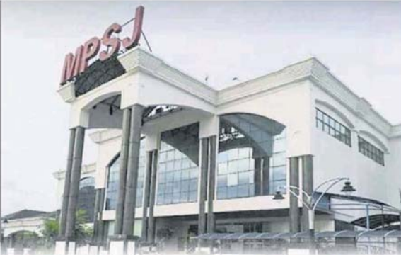
梳邦再也市議會將在2020年將就升格事情，申請鑒布完