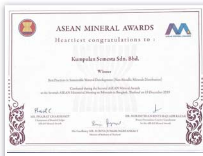
KSSB memperoleh sijil tempat pertama bagi anugerah kategori Amalan Terbaik Dalam Pembangunan Mineral yang Mampan.