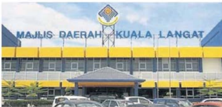
雪州政府早前率先宣布瓜冷县议会升格为市议会。

他也说，梳邦再也市议会的2020至2035年的蓝图中也会专注交通导向发展(TOD)，尤其是在已建设轻铁站的密集区，提升为高素质的城市，提供有品牌的服务。