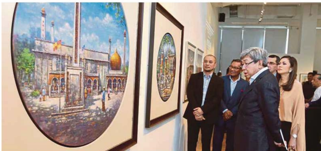
Sultan Selangor Sultan Sharafuddin Idris Shah bersama Tengku Permaisuri Selangor, Tengku Permaisuri Norashikin melihat lukisan pada majlis perasmian Pameran Senilukis bertemakan Mihrab - Pameran Seni Lukis Bertemakan Masjid di Whitebox, Publika, Kuala Lumpur.